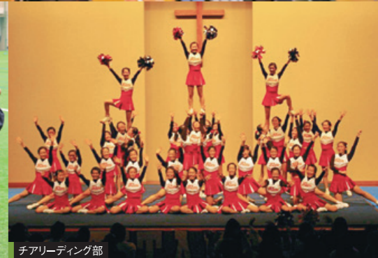
チアリーディング部