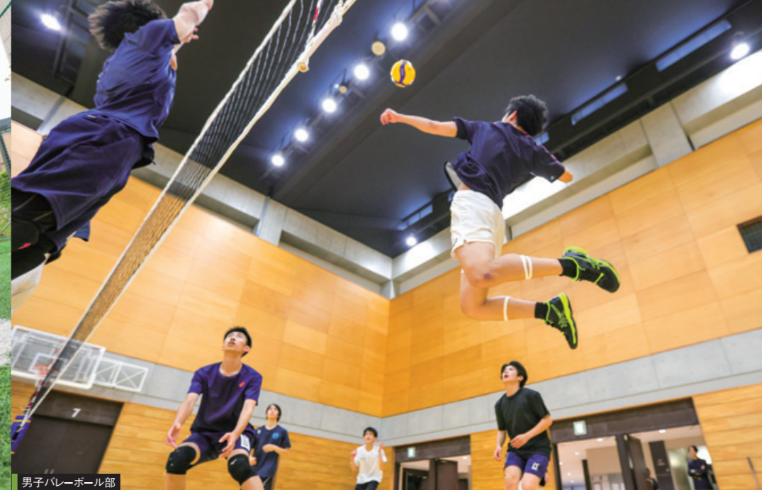
男子バレーボール部