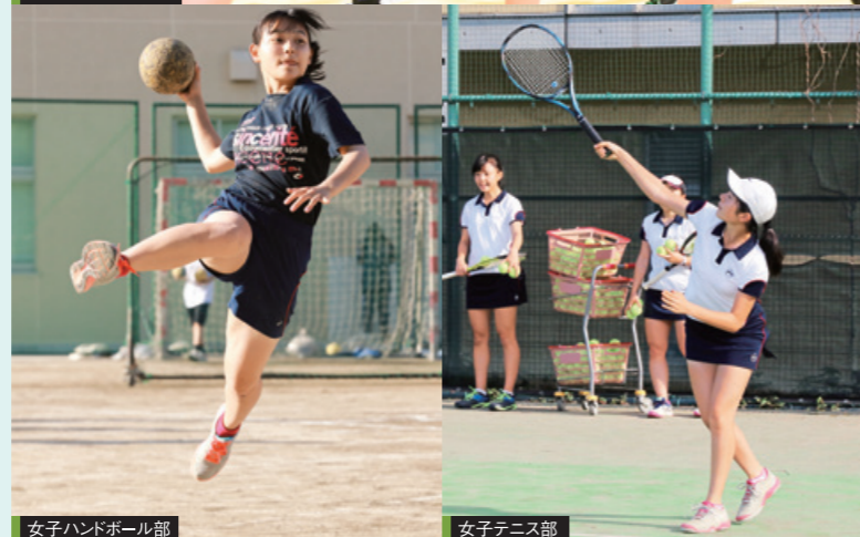
女子ハンドボール部